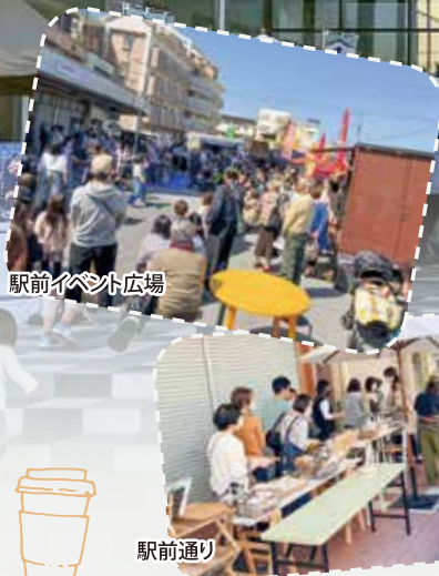
駅前イベント広場