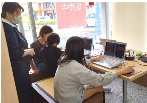
【8】広がれ未来♪ 親子プログラミング体験教室