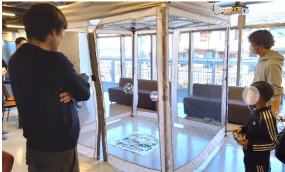
【5】はじめての ドローン相撲体験