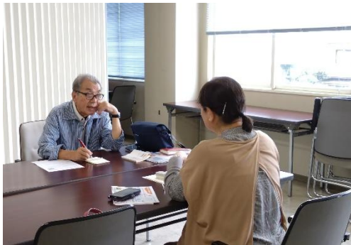
【1】マイナス資産を活用して 収益をあげる