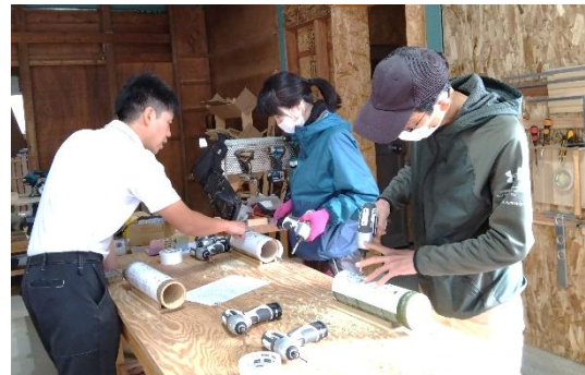
【25】初心者でもできる！ オリジナル竹あかり作り