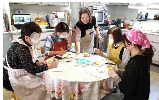
【13】常温でぷるぷる！ 不思議なアガーゼリー講座