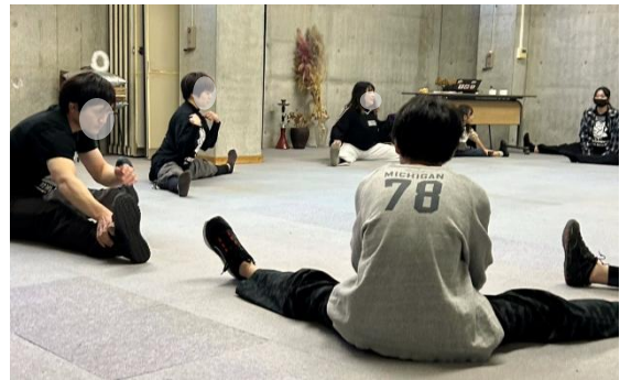
【2】演劇に挑戦！身体表現で、 クリエイティブながら楽しく運動！