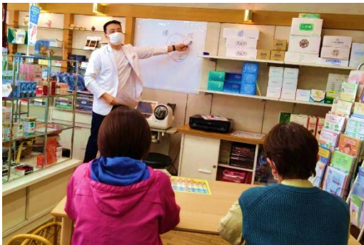
【24】今日からできる！東洋医学で 認知症予防の基礎講座