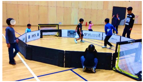
【17】ストリートサッカー・ 親子サッカー