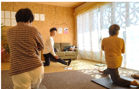
【20】いつまでも歩ける！ 膝痛予防教室