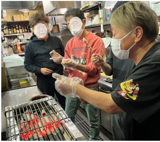
【16】店長直伝！ 焼き鳥串のさし方・焼き方