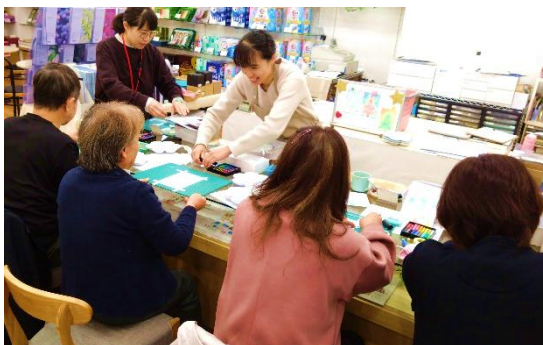
【28】初めてのパステルアート🌈 クリスマスカードを作ろう！